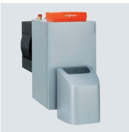
Vitorondens 200-T de 67,6 à 107,3 kW