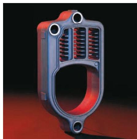
Les surfaces d'échange Eutectoplex en fonte grise spéciale garantissent une haute fiabilité et une longévité importante

Bénéficiez de la simplicité d'utilisation de la régulation Vitotronic 200 : intuitive et conviviale, la régulation vous permet de gérer un circuit direct (radiateurs) et jusqu'à deux circuits avec vanne mélangeuse (radiateurs ou plancher chauffant).