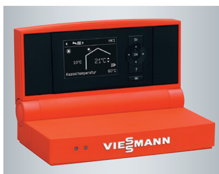
Régulation Vitotronic avec menu déroulant clairement structuré